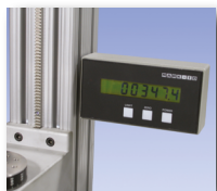
Indicateur d'angle numérique (TST001)

Couplemètre intégré de base pour diverses applications. Disponible en 6 capacités de 7 à 1150 Ncm.